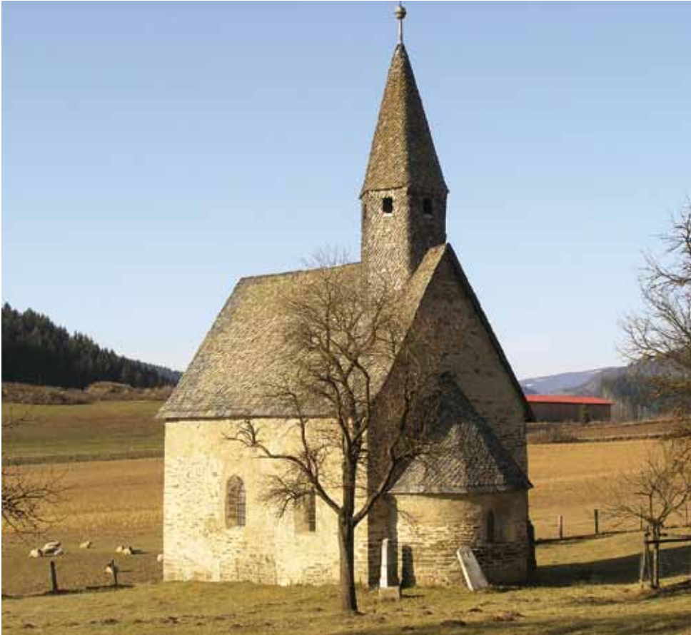
Die kleine Kirche von Kaberstein bei Althofen, ein romanischer Apollonbau.