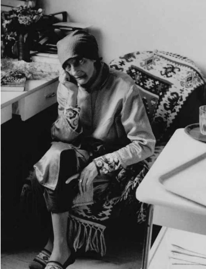
Christine Lavant.